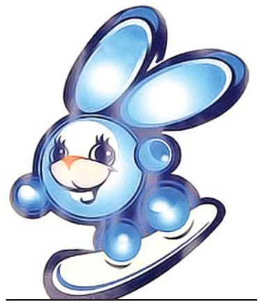
Символ Года спорта и здорового образа жизни

Кроме того, в празднике примут участие большинство спортивных организаций округа, и у родителей будет возможность прямо во время праздника познакомиться с работой этих клубов и записать ребенка, или записаться самим в любой спортивный кружок и секцию, действующий в округе.