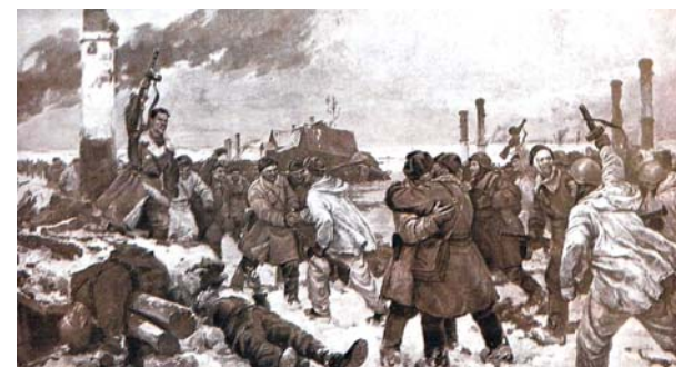
Прорыв блокады Ленинграда. 1943. Художники В. Серов, И. Серебряный